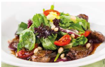
Теплый салат с куриной печенью