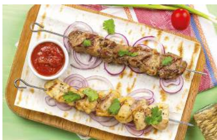
Шашлык из свинины и из курицы