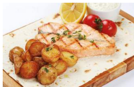
Стейк из семги