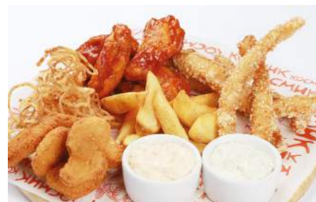
Сет куриных снеков к пиву